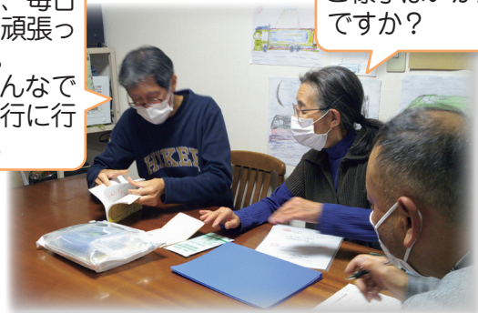
生活支援員とグループホームの世話人による情報交換の様子