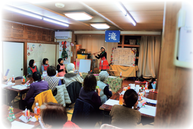
滝支部のクリスマス会

ふれあい・いきいきサロンと多世代交流は、身近な地域住民同士が会食や談話、ゲームなどを通して、楽しくふれあう仲間づくりや生きがいづくりの場です。