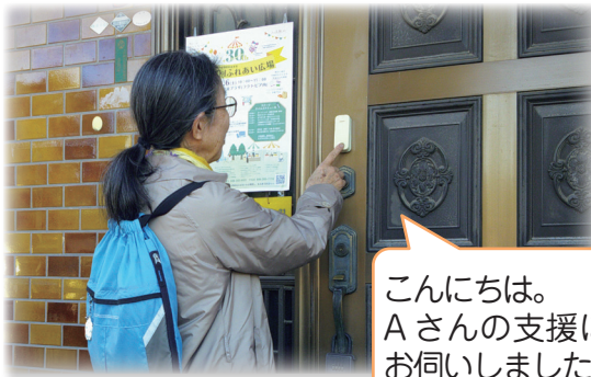
生活支援員の訪問の様子

「あんしんサポートねっと(福祉サービス利用援助事業)」は、物忘れなどのある高齢者や知的障がい・精神障がいなどのある方が安心して生活が送れるよう、定期的に訪問し、福祉サービスの利用や生活に必要なお金の出し入れなどをお手伝いするサービスです