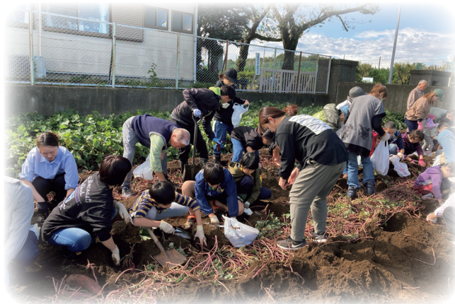
亀久保西支部と町会合同の「芋掘り大会」