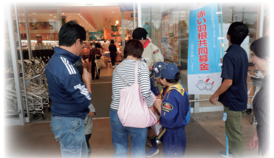
ボーイスカウト 埼玉県連盟ふじみ野第1団 (ヤオコー大原店にて)