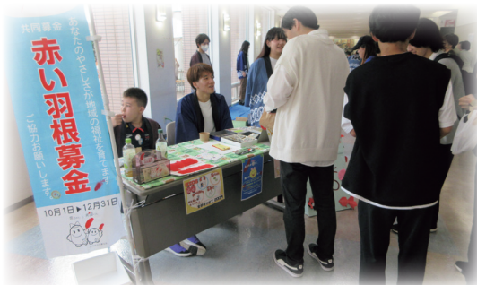
文京学院大学地域連携センター BICS (あやめ祭にて)